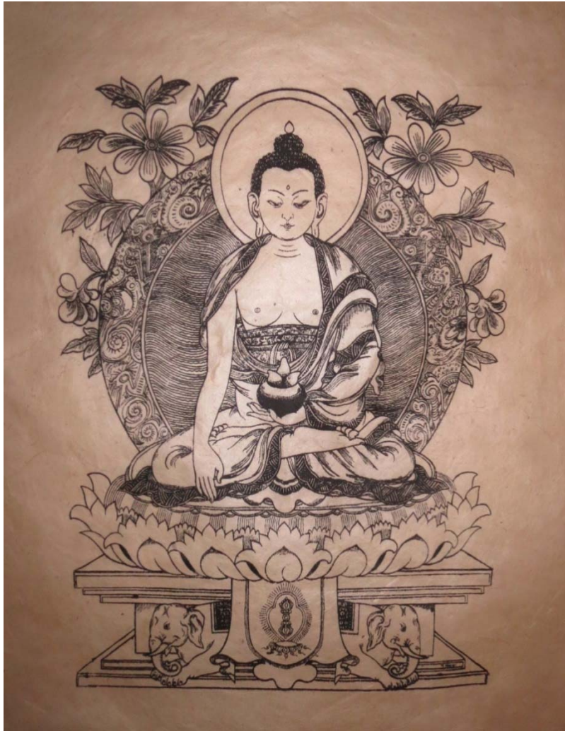
Buddha Śākyamuni als Heilender, als Heiland